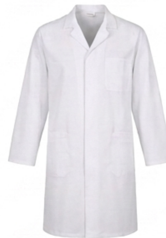
Blouse de laboratoire. En coton ou matière ignifugée, fermée devant, à manches longues.