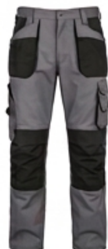
Pantalon de travail. Résistant, adapté aux travaux manuels.