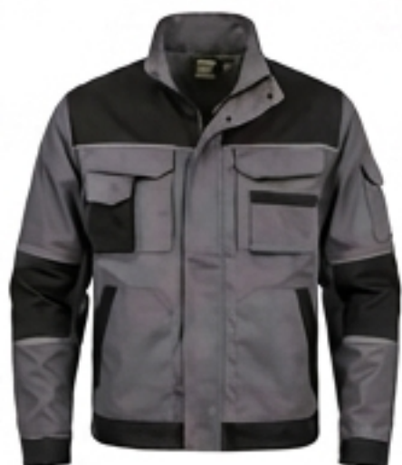
Veste de travail.