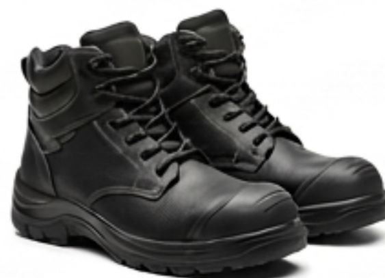
Chaussures de sécurité. Normes EN ISO 20345 (semelle anti-perforation, embout de protection).